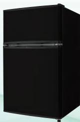
ブラック 品番：TH-90L2-BK JAN：4580039196111