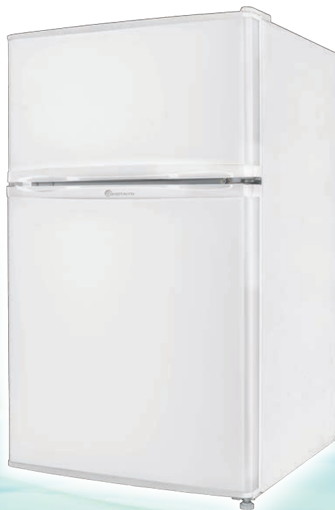
ホワイト 品番：TH-90L2-WH JAN：4580039196104