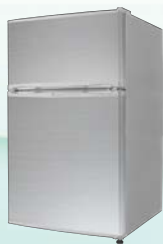
シルバー 品番：TH-90L2-SL JAN：4580039196135